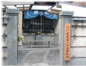
地域や子供たちを守ってくれているのかな?