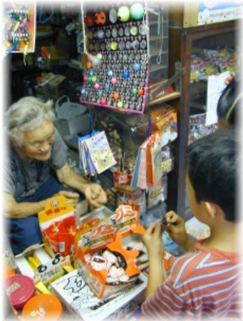
子供たちのお目当ては・・・お菓子? おばあちゃんのお話?