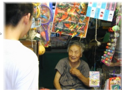
帰省中の学生さんと・・・

それから・・・実はこのお店は車1台分の幅くらいしかない細い道に面しているのですが、子供たちがふざけたりして急に店を飛び出すこともあるそうで、でもこれまでに一度も事故がなく、お店の隣にある「福岡市新四国霊場第八四番札所」にまつられているお地藏さんのおかげではないかということでした。