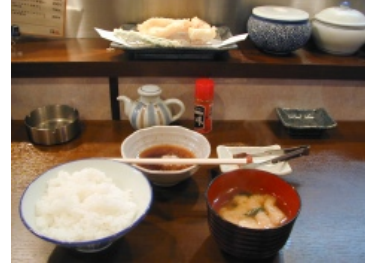
海鮮定食 700円：天ぷらは次々と出されて、かなり満足でした。

インターネット上では瓦版対象地域のお店などを順次案内していく予定です。協力者も募集していますm( )m CANOMATE