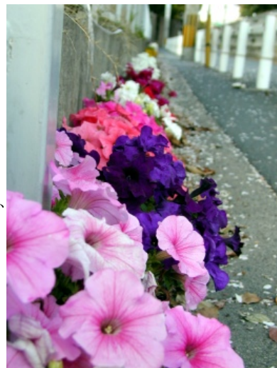
僅かな隙間に植えられた色とりどりの花々

僕も高校時代は清掃登山やったり駅前清掃やったりしたが、駅前の清掃にしても週1だった(駅が多少広かったのと部員が少な